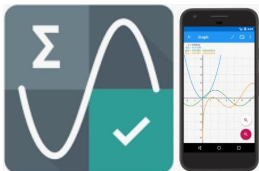
Figura 1, 2. Logo e inicio de Algeo Graphing Calculator.

A la hora de elegir un software de enseñanza de matemáticas lúdicas para niños, es importante tener en cuenta los siguientes factores: