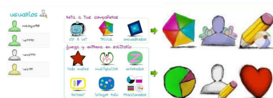
Figura 9, 10. Logo e inicio de Retomates.