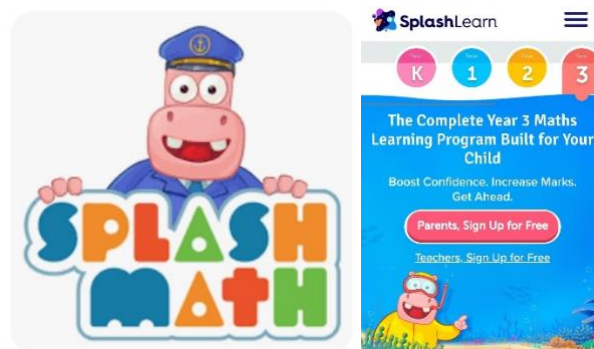
Figura 1, 2. Logo e inicio de Splash Math.

Splash Math es una aplicación que cubre una amplia gama de temas matemáticos, desde la suma y la resta hasta la geometría y las fracciones. El programa es muy interactivo y ofrece a los niños la posibilidad de practicar a su propio ritmo.