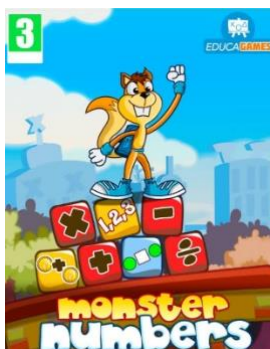
Figura 6. Logo e inicio de Monster numbers.