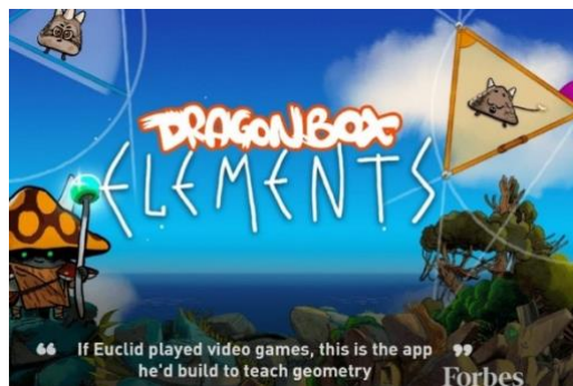
Figura 5. Logo e inicio de Dragonbox.

Otros softwares de enseñanza de matemáticas lúdicas para niños son: