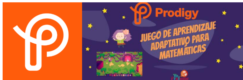
Figura 3, 4. Logo e inicio de Prodigy.

El juego Prodigy es un juego de rol en el que los niños pueden explorar un mundo virtual mientras resuelven problemas matemáticos. El juego es muy motivador y ayuda a los niños a desarrollar sus habilidades de razonamiento lógico.