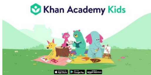
Figura 8. Logo e inicio de Khan Academy Kids.